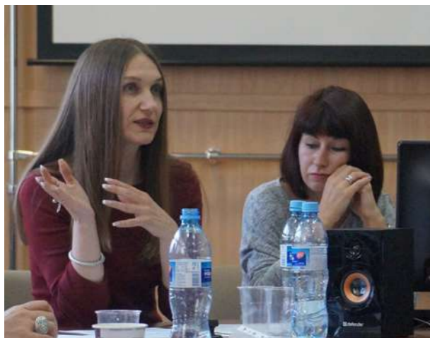
Конференция «Что сказал бы Фрейд? Практика и техника психоанализа и психотерапии в современных условиях», октябрь 2019 г.

молоко, сперма, кровь, экскременты. И вся символика крутится вокруг жизненных проявлений человека, связанных с зачатием, деторождением, смертью, убийством, вокруг актов, связанных с максимальным эмоциональным, аффективным напряжением.